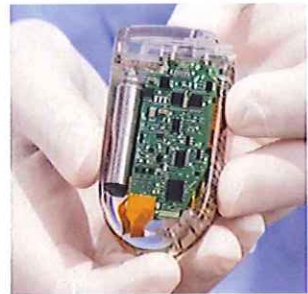
マイクロモーター内蔵機器

医療カテーテル・内視鏡等の精度を向上させるため、マイクロモーターに使用される部品を世界最小クラスまで小型化するための試作開発を行います。